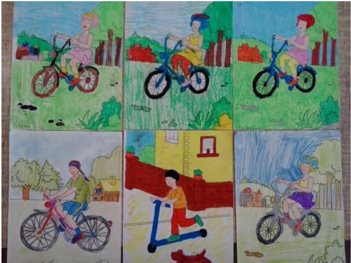
Opiekun Szkolnego Koła PCK