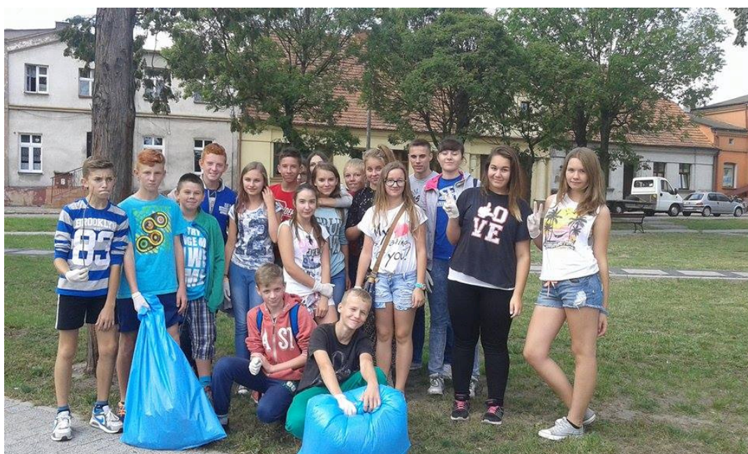
Klasa IA gimnazjum.